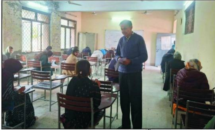
راولپنڈی، کنٹرولر امتحانات تعلیمی بورڈ تنویر اصغر اعوان مختلف امتحانی مراکز کا دورہ کر رہے ہیں