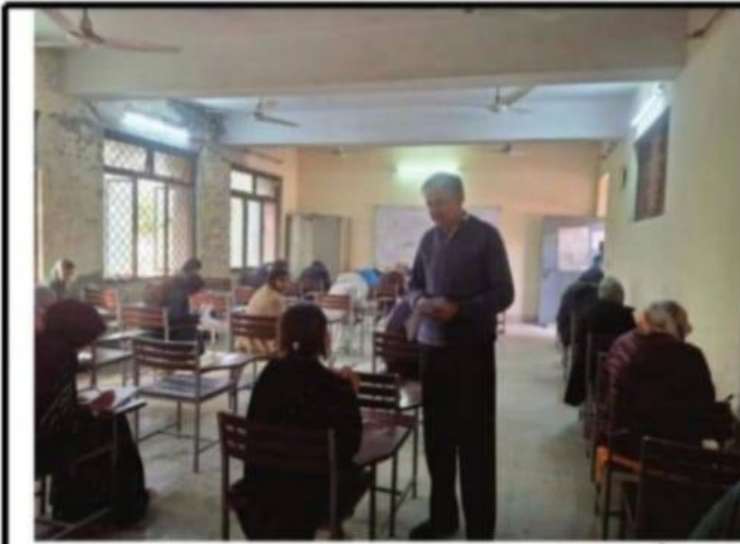
کنٹرولر امتحانات تعلیمی بورڈ راولپنڈی تنویر اصغر اعوان امتحان انٹرمیڈیٹ پارٹ-1 اور سالانہ 2025 کے سلسلے میں امتحانی مراکز کا دورہ کرتے ہوئے

کنٹرولر امتحانات تنویر اصغر اعوان کے مختلف امتحانی مراکز کے دورے، زیر و نالرس پالیسی پر مکمل عملدرآمد، امتحانی عملہ اور بورڈ انتظامیہ خراج تحسین کی مستحق