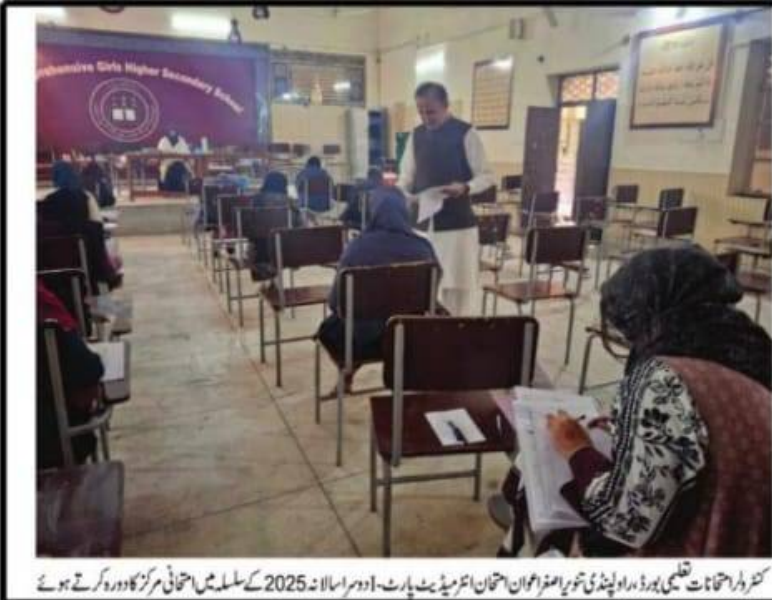
کثیر و لامتناہی تنویر اصغر اعوان امتحان انٹرمیڈیٹ پارٹ-1 اور سالانہ 2025 کے سلسلہ میں امتحانی مراکز کا دورہ کرتے ہوئے

سیکیورٹی، سی سی ٹی وی کیمروں، امتحانی ایس او پیز اور مارکنگ سینٹرز کے انتظامات کا تفصیلی جائزہ، بوٹی مافیا کے خاتمے میں نمایاں کامیابی