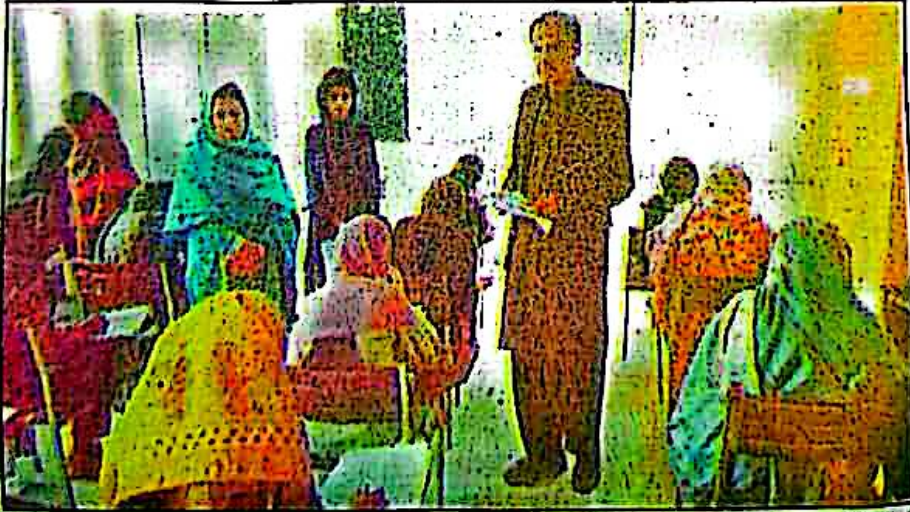
کنٹرولر جنرل جنرل ایڈمنسٹریشن کے سلسلہ میں امتحانی مراکز کا دورہ کر رہے ہیں