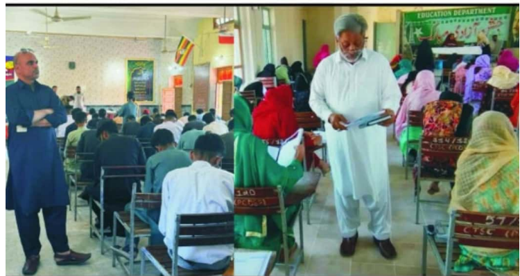
راولپنڈی، چیئرمین تعلیمی بورڈ عدنان خان، کنٹرولر امتحانات پروفیسر ساجد محمود فاروقی انٹرمیڈیٹ فرسٹ اینڈل امتحانات کے سلسلے میں مختلف امتحانی مراکز کا دورہ کر رہے ہیں۔

راولپنڈی (نیوز رپورٹر) وزیر اعلیٰ پنجاب مریم نواز کے ویژن کے مطابق اور حکومت پنجاب کی ہدایت کی روشنی میں چیئرمین تعلیمی بورڈ راولپنڈی نے امتحان انٹرمیڈیٹ فرسٹ اینڈل 2024 کے سلسلہ میں گورنمنٹ ہائی سکول نمبر 1، حضرو، گورنمنٹ گرلز ہائی سکول نمبر 2، حضرو، گورنمنٹ گرلز ہائی سکول نمبر 3، حضرو، گورنمنٹ ہائیر سیکنڈری سکول شادی خان، کیڈٹ ایج انک، گورنمنٹ پبلک سیکنڈری سکول انک (پری لیٹل لیب، مارکنگ سینٹر، امتحانی مرکز)، گورنمنٹ ایس او ایٹ کالج فار ویمن انک، گورنمنٹ گرلز ہائی سکول بر 2، گورنمنٹ گرلز ہائی سکول نمبر 1، انک، گورنمنٹ انز ہائی سکول نمبر 1، فتح جنگ (مارکنگ سینٹر، امتحانی مرکز)، گورنمنٹ ایس او ایٹ کالج فار ویمن فتح جنگ، ملح انک کا دورہ کیا۔ دورے کے دوران شامل امتحان سید واران کے بیٹھنے کا پلان، سی۔ سی۔ ٹی۔ وی کیمبرے ریسکوری کے انتظامات کا بخور جائزہ لیا۔ دورے کے بعد گفتگو کرتے ہوئے انہوں نے کہا امتحانی انتظام میں جدید طرز پر اصلاحات لارہے ہیں۔ میرٹ اور شفافیت کوئی سمجھوتہ نہیں کیا جا رہا۔ زیرو ٹارگٹس پالیسی کی دولت بوٹی مافیا کو کافی حد تک لگام ڈالنے میں کامیاب ہو چکے ہیں۔ انشا اللہ تعالیٰ انٹرمیڈیٹ پارٹ-I جو کہ