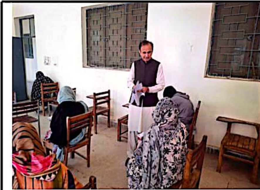
کنٹرولر امتحانات تعلیمی بورڈ، راولپنڈی تنویر اصغر اعوان امتحان انٹرمیڈیٹ دوسرا سالانہ 2025 کے سلسلہ میں مختلف امتحانی مراکز کا دورہ کرتے ہوئے

امتحان انٹرمیڈیٹ دوسرا سالانہ 2025 زیر نالرس پالیسی کے تحت شفاف اور منظم انداز میں جاری