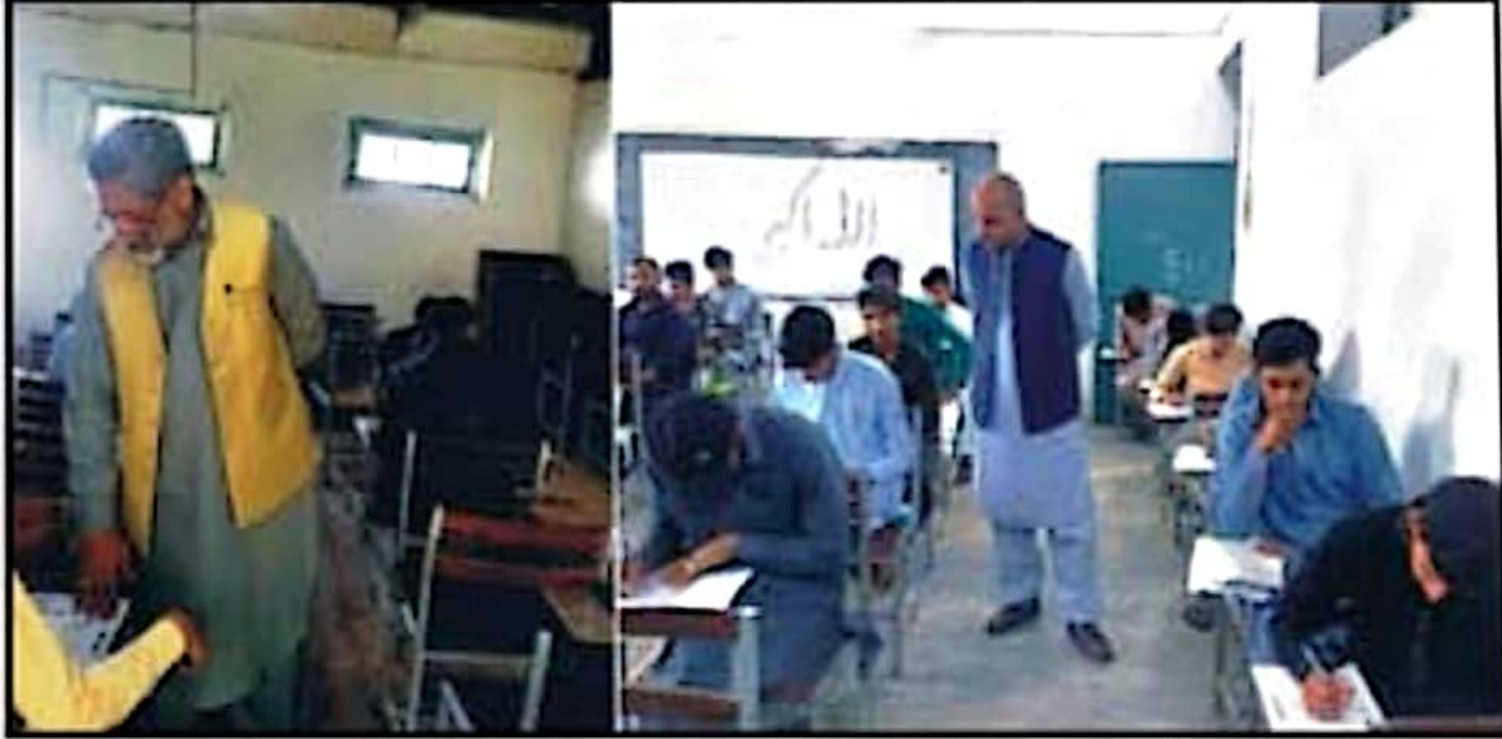
ڈیپارٹمنٹ آف اسلامی سائنس، بورڈ آف ایجوکیشن، لاہور نے امتحان نیم سیکنڈ ایئر 2023 کے مختلف اسلامی مراکز کا اہم دورہ