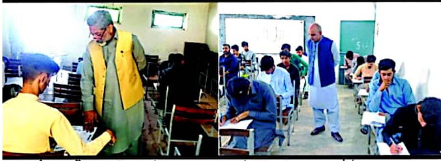
راولپنڈی، چیئر مین تعلیمی بورڈ محمد عدنان خان، کنٹرولر امتحانات پروفیسر ساجد محمود فاروقی امتحان نم سیکنڈ اینول کے مختلف امتحانی مراکز کا دورہ کر رہے ہیں۔