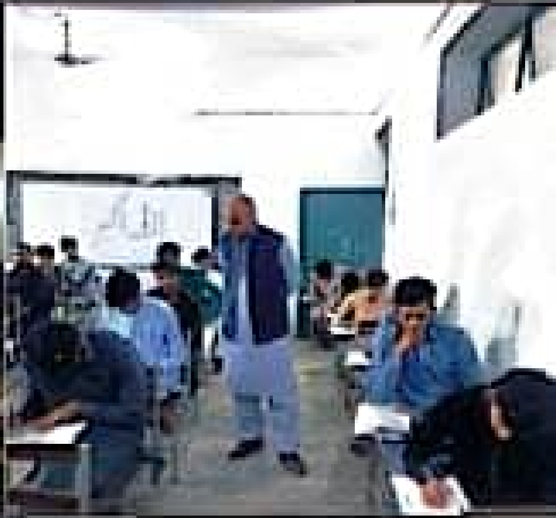
راہنمائی، توجہ دینا، معائنہ کرنا اور کمرہ کی صفائی وغیرہ پر مبنی عملی مشقوں کے ذریعہ امتحان لیا جاتا ہے۔