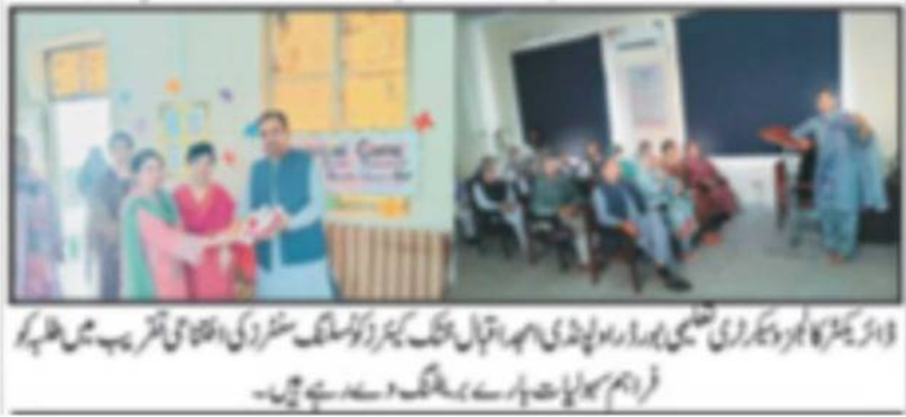
ڈائریکٹر کالج اور کوریٹنگ کمیٹی سربراہ راولپنڈی سہ ماہی ہنگ کی کیریئر کونسلنگ سنٹرز کی افتتاحی تقریب میں طلبہ کو فریڈم کی بات دینے پر سہ ماہی ہنگ دست ہے۔